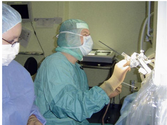
Abb. 1 Einführen der Elektrode