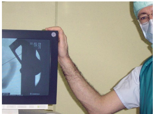
Abb. 2 Intraoperative Kontrolle der Elektrode mit Bildwandler

kum Frankfurt/Oder GmbH und einer der Pioniere dieser Behandlungsmethode. Die von Funk benutzten Hirnschrittmacher bestehen aus einer Vierpol-Elektrode von 1mm Durchmesser. Die Elektrode wird operativ im Nucleus subthalamicus platziert. Sie stimuliert dort bei einer Spannung von rund 2 Volt und einer Frequenz von 180 Hertz eine Gruppe von Zellen, die nicht mehr richtig funktioniert und dadurch das Ruhezittern (Tremor) bei Parkinson-Patienten verursacht. Die elektrische Stimulation reguliert die zu stark aktivierten Zellen auf das normale Mass herunter und stellt so das «gesunde»