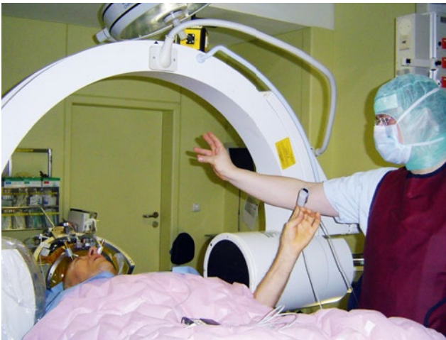
Abb. 3 Intraoperative Testung auf Wirkung und Nebenwirkung

Gleichgewicht zwischen Spannungsaufbau und -abbau wieder her. Die Elektrode erhält die Elektropulse von einem Schrittmacher, der in der Regel in den Brustmuskel oder in den Bauchspeck implantiert wird.